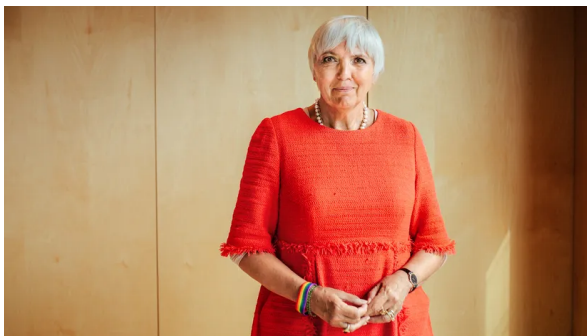
Claudia Roth, geboren 1955 in Ulm, war bisher Vizepräsidentin des Deutschen Bundestags. Jetzt übernimmt sie von Monika Grütters das Amt der Staatsministerin für Kultur und Medien.

DIE ZEIT: Ist es schön, wenn man unerwartet ein Amt bekommt?